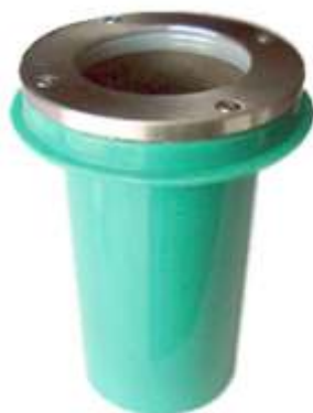
SP2104 (GU-10) SP2104 12V (G-5.3)